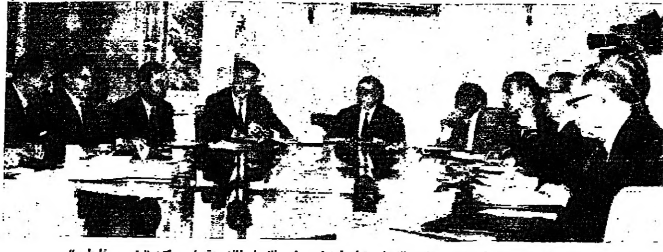
دولة السيد بهجت التلهوني رئيس الوزراء اجتمع مجلس الاعمار برئاسة السيد بهجت التلهوني

سئل الكاتب الكبير (ميكائيل نعيمة) : هل في الأدب العربي الحديث آثار كثيرة تبقى لها قيمتها لو ترجمت الى لغات اجنبية ؟